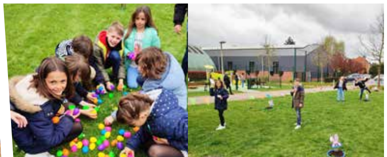
11 avril : Chasse à l'oeuf du Conseil Municipal des Enfants Ecole Jeunesse