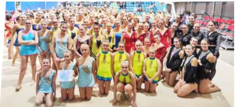
2 avril : Championnats régionaux - GRS