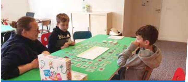
9 mars : Ouverture de la ludothèque 30 jeux disponibles à l'emprunt - Bibliothèque