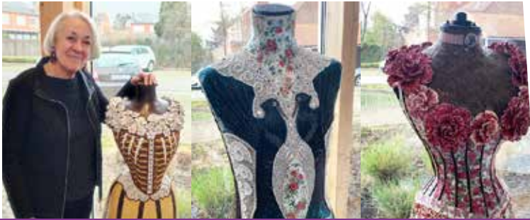
19 mars : Femmes sans blessure apparente Exposition Annie Busin - CCAS