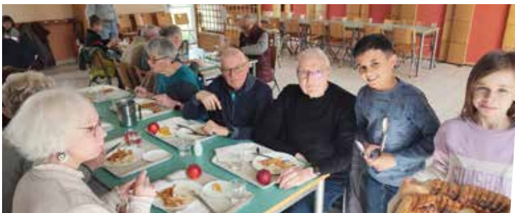
14 avril : Repas entre aînés et membres du Conseil Municipal des Enfants - Ecole Jeunesse