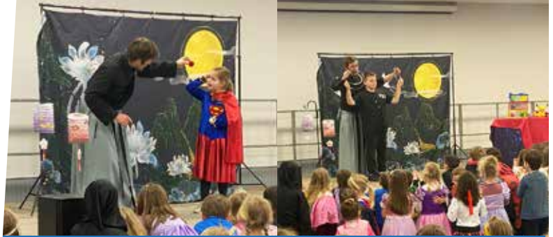
12 mars : Carnaval de l'APE