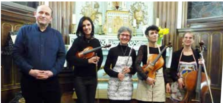
31 mars : concert de printemps - Sailly en Fête