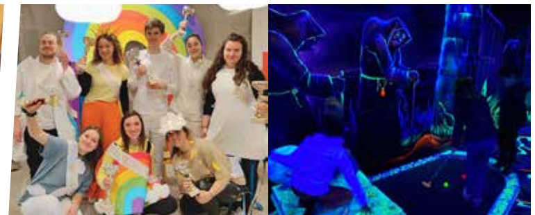
Equipe météo du Centre - Sortie minigolf fluorescent Centre de loisirs Printemps 2023 - Ecole Jeunesse