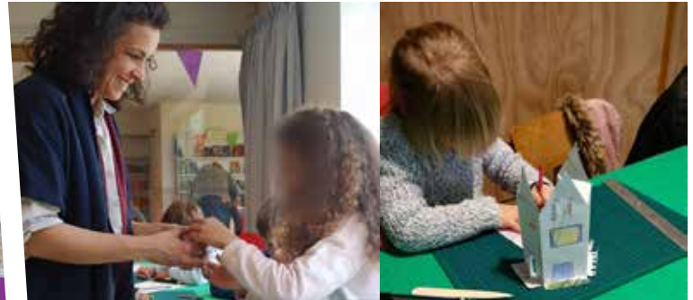
26 mars : Ateliers créatifs - Bibliothèque