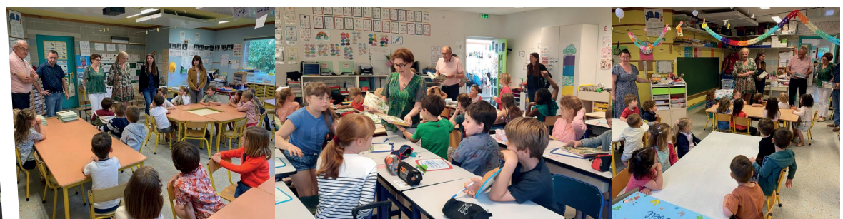
28 juin : Distribution des livres offerts par la municipalité aux élèves des écoles de Sully par des représentants du Conseil Municipal