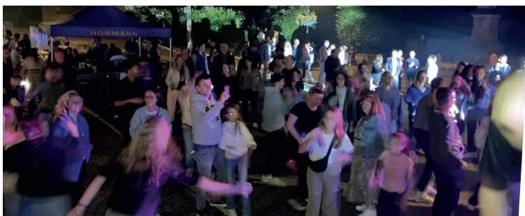
22 juin : Pas de pluie pour une très belle fête de la musique Quel beau et bon moment !!!