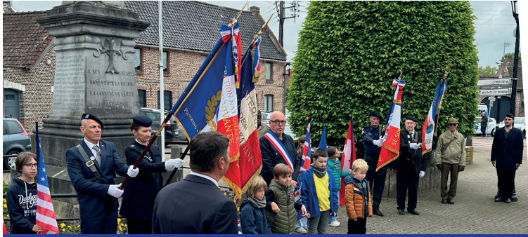
8 mai : Commémoration de la Victoire du 8 mai 1945