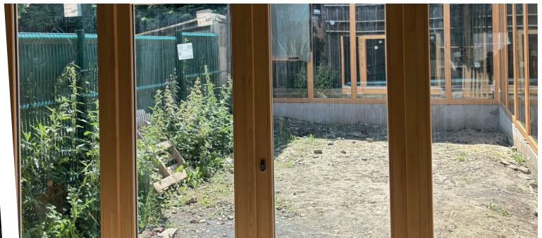
Le patio vu depuis les futures salles de réunion