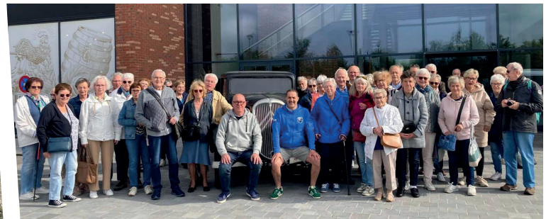
19 juin : Sortie des aînés dans l'Audomarois - CCAS