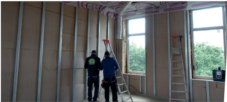
Isolation et doublage du futur bureau du secrétaire de mairie