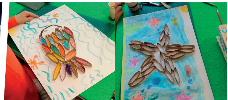
23 juin : Atelier récréatif à la bibliothèque