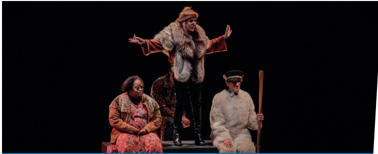
24 mai : Spectacle "Loin dans la mer" par l'Oiseau-Mouche. Prestation très appréciée, d'une très grande qualité