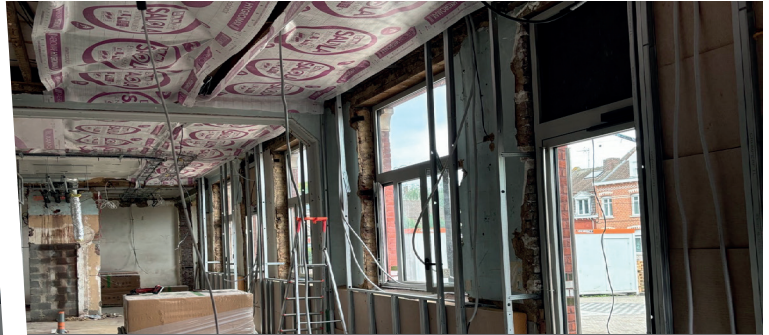
Isolation de la salle des mariages et du Conseil