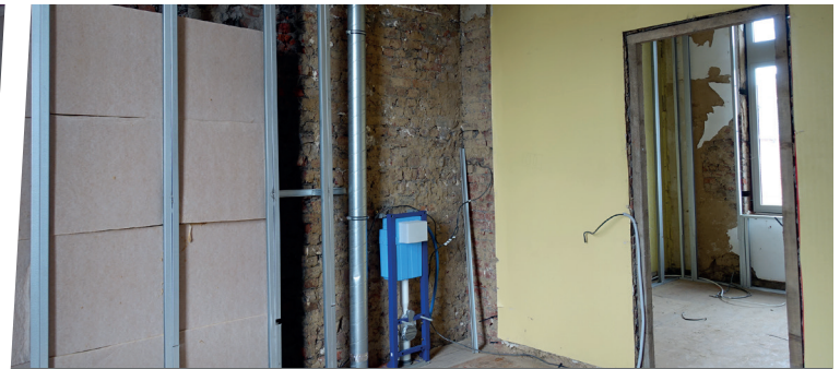
Création de sanitaire à l'étage