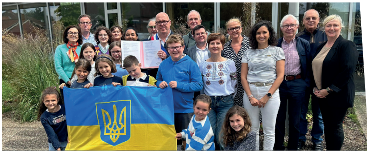
15 juin : Signature de la délibération de mise en place du jumelage avec Semenivka lors du Conseil Municipal