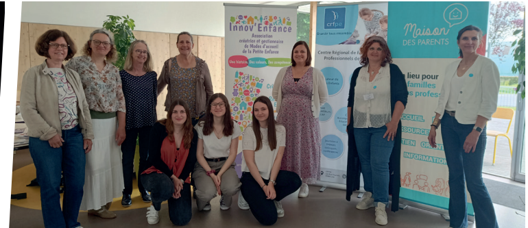
8 juin : 1 ère matinée de la petite enfance - CCAS