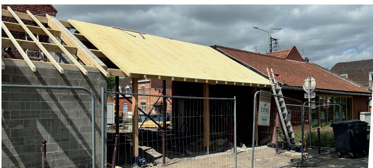
Vue du préau depuis le chemin des Écoliers