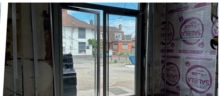
La nouvelle entrée vue du service administratif