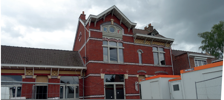
Ravalement de la façade principale en cours