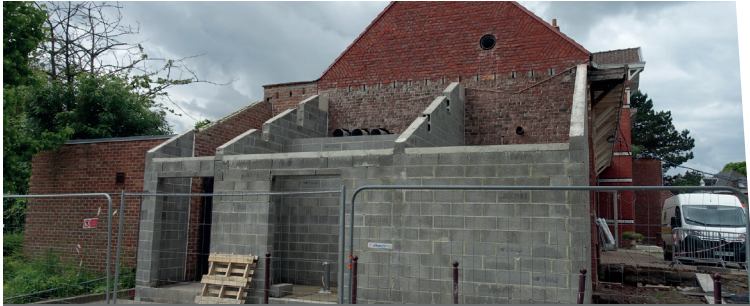
Chemin des Écoliers : Agrandissement abritant local technique, local poubelles, entrée annexe, rangement salle des mariages / du conseil