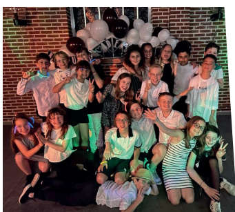
25 juin : Boom des CM2 avant le collège